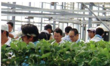
『西部地区JA 青壮年部視察交流会』 今年のテーマ「絆」、県下5JA青壮年部の交流会に17名参加。