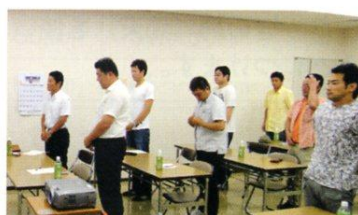
『ファーマーズクラブ視察研修』 「JAたじま」へクラブ員17名が参加。地域ブランドへの取り組みを傍聴。